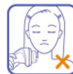
неправильное использование прибора