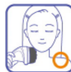
используйте защитную насадку, чтобы не повредить волосы

Не используйте прибор без защитной насадки в тех местах, где волосы могут попасть в прибор (шея или плечи).